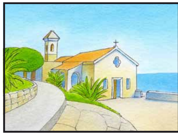
9 CHIESETTA DI SANT'AMPELIO • Via S.ampelio S.Ampelio Church and Cape, Street S.Ampelio

UFFICIO INFORMAZIONI E ACCOGLIENZA TURISTICA (I.A.T.) Via Vittorio Emanuele 172 - Tel. +39 0184.26.28.82