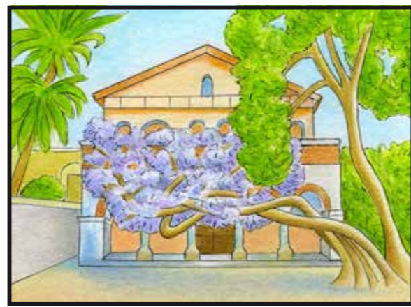
7 MUSEO BICKNELL-ISTITUTO STUDI LIGURI Via Romana 39 / Museum Bicknell-International Institute of Ligurian Studies, Street Romana 39