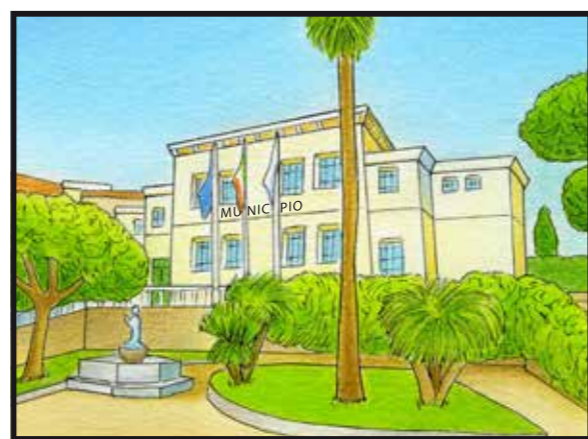
1 PALAZZO GARNIER • Via XX Settembre 32 Garnier Palace, Street XX Settembre 32

UN PERCORSO STORICO E NATURALE, DIECI TESORI DA SCOPRIRE E CONOSCERE A HISTORICAL AND NATURALISTIC TRAIL, TEN TREASURES TO DISCOVER