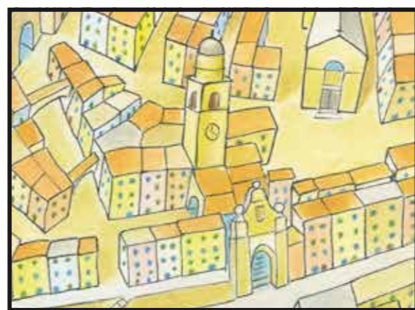
2 CENTRO STORICO • Bordighera Alta, Via Circonvallazione Historic Centre, Street Circonvallazione