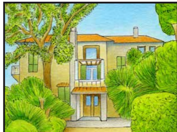
4 VILLA FONDAZIONE MARIANI • Via fontana Vecchia,17 Mariani Foundation, Street Fontana Vecchia 17