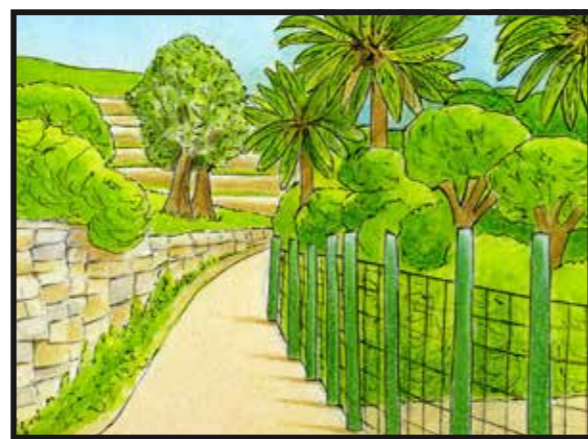
5 SENTIERO DEL BEODO • Via Beodo Natural Trail Beodo, Street Beodo