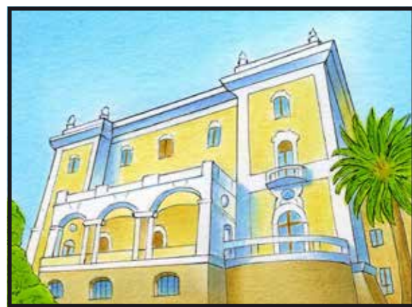
6 VILLA REGINA MARGHERITA • Via Romana, 34/36 Queen Margherita Ville, Street Romana 34/36