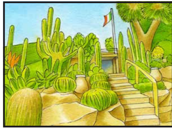
10 GIARDINO ESOTICO PALLANCA • Via Madonna della Ruota 1 (Via Aurelia) / Pallanca exotic Gardens, Street Madonna della Ruota 1 (Street Aurelia)