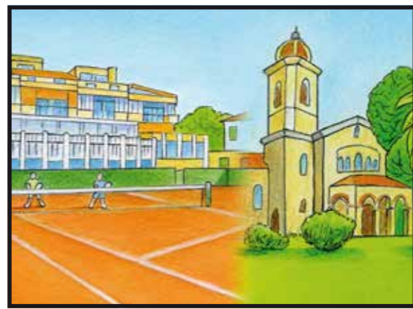
8 TENNIS CLUB BORDIGHERA - EX CHIESA ANGLICANA Via Antonio Stoppani / Bordighera Tennis Club - Ex Anglican Church, Street Antonio Stoppani